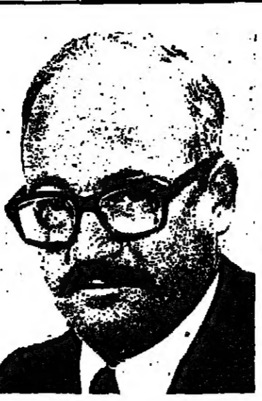
بقلم : عاموس عيران

التصاق عضو مجلس النواب جون أندرسون ، الذي سيزور البلاد في الاسبوع القادم ، بسباق الرئاسة الأميركية كمرشح مستقل يثير قلقا كبيرا في اوساط المرشحين الرئيسيين كارتر وريغان ، ان نجاح جون أندرسون النسبي في استطلاعات الرأي العام ، يفسر احتمال انتخاب الرئيس الأميركي الجديد من قبل مجلس النواب في واشنطن .